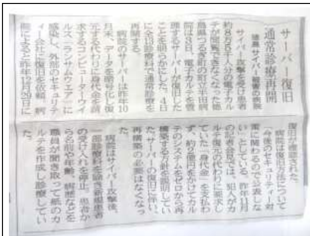
北日本新聞 令和4年1月4日の記事

一部診療科を除き 新規患者の受け入れを停止。患者から 名前や、年齢を聞き取り 紙のカルテを作成し診療を続けた。犯人が要求する【身代金】を支払わず 令和3年12月29日に 復旧が 確認された。