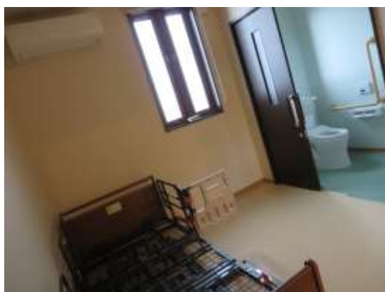
グループホームの各部屋に トイレと洗面台を設置し 個人の尊厳に配慮されていた。

投資金額は 約1億7500万円。長期借入金の金利条件が 最初の5年間は 年1%を 下回っている……魅力的な報告がありました。